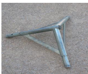
6 JONCTIONS TOITURE