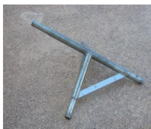
3 JONCTIONS TOITURE INTERIEURES