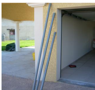
6 tubes de 2.46 m 6 tubes de 2.27 m 6 tubes pieds avec platines